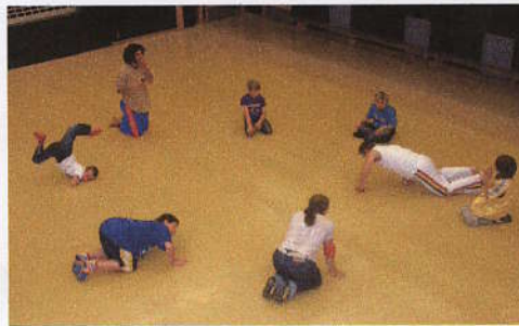
Store og små har det gøy på nybegynnerkurs