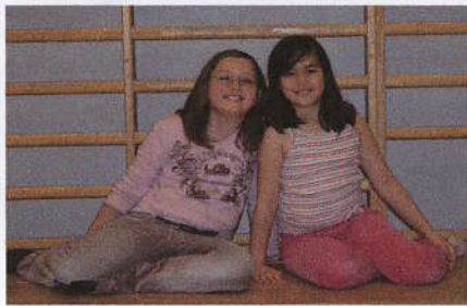
Det er litt mye skravling og masse latter.

På tirsdager har vi svømming etter lek-sene. På fredager trenger vi ikke å gjø-re lekser, da er det fritt, og vi kan være i gymsalen. Da har vi konkurranser og leker.