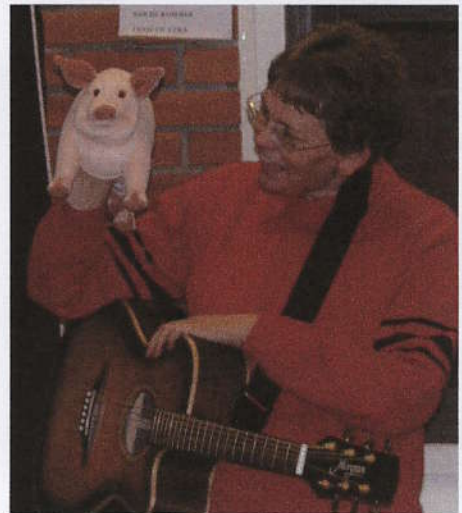
Grisen var en av de gode vennene!